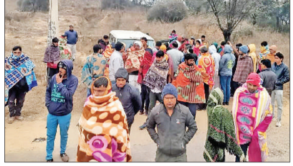
बाढ़ड़ा। खोरड़ा पहुंची वन विभाग की टीम व मोकै पर मौजूद ग्रामीणों की भीड़