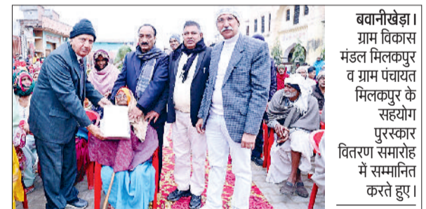
भिवानीखेड़ा। ग्राम विकास मंडल मिलकपुर व ग्राम पंचायत मिलकपुर के सहयोग पुरस्कार वितरण समारोह में सम्मानित करते हुए।

गांव मिलकपुर में पुरस्कार वितरण समारोह का किया आयोजन