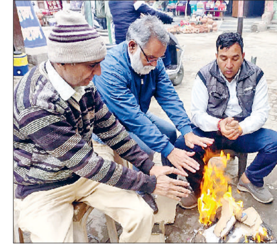
भिवानी। ठंड से बचने के लिए अलाव सेकते हुए।

सोमवार को कड़ाके की ठंड की वजह से जनजीवन पूरी तरह से प्रभावित रहा। पारा सात डिग्री सेल्सियस पर पहुंचने के चलते हर कोई आहत नजर आया। हाड़ कंपा देने वाली ठंड चलते लोगों की दिनचर्या देर से शुरू और शाम के वक्त जल्दी ही लोग अपने घरों में दुबक गए। इस दौरान लोगों ने अलाव का सहारा लेकर अपने आप को ठंड से बचाने का प्रयास किया। दूसरी तरफ कड़ाके की ठंड रबी फसलों के लिए फायदेमंद मानी जा रही है। चूंकि इस मौसम में जितनी ज्यादा ठंड होगी। उसी हिसाब से गेहूं व सरसों की फसलों में फुटाव बढ़ेगा। सुबह जब लोग सोकर उठे तो उस वक्त आमसान में बादल छाए हुए थे। जैसे ही दिन चढ़ना शुरू हुआ तो ठंड भी बढ़नी शुरू हो गई। धीमी गति से हवा बचने