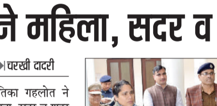
थानों की बिल्डिंग, तमाम रिकार्ड, सीसीटीवीएनएस एवं कंप्यूटर कक्ष का निरीक्षण किया

औचक निरीक्षण करते हुए पुलिस अधीक्षक ने थानों की बिल्डिंग, तमाम रिकार्ड, सीसीटीवीएनएस एवं कंप्यूटर कक्ष का निरीक्षण किया। थाना के एमएचसी कक्ष के रिकार्ड की बारीकी से जानकारी ली। उन्होंने थाना में थाना प्रबंधक के कार्यालय स्थित महिला सेल, महिला