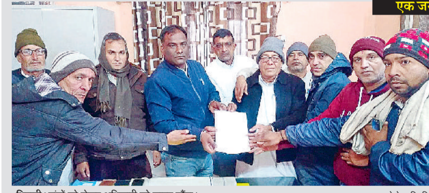
भिवानी। मांगों को लेकर अधिकारी को जापान सौंपा।

यह कानून गलत है इसे वापस लिया जाए। उन्होंने कहा कि 600 राशन कार्डों पर एक डिपो होता था