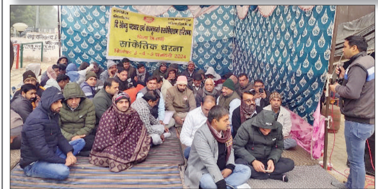
भिवानी। उपायुक्त कार्यालय के बाहर नारेबाजी करते पटवारी और पटवारियों की हड़ताल के बाद सूनासन पड़े पटवारखाना।